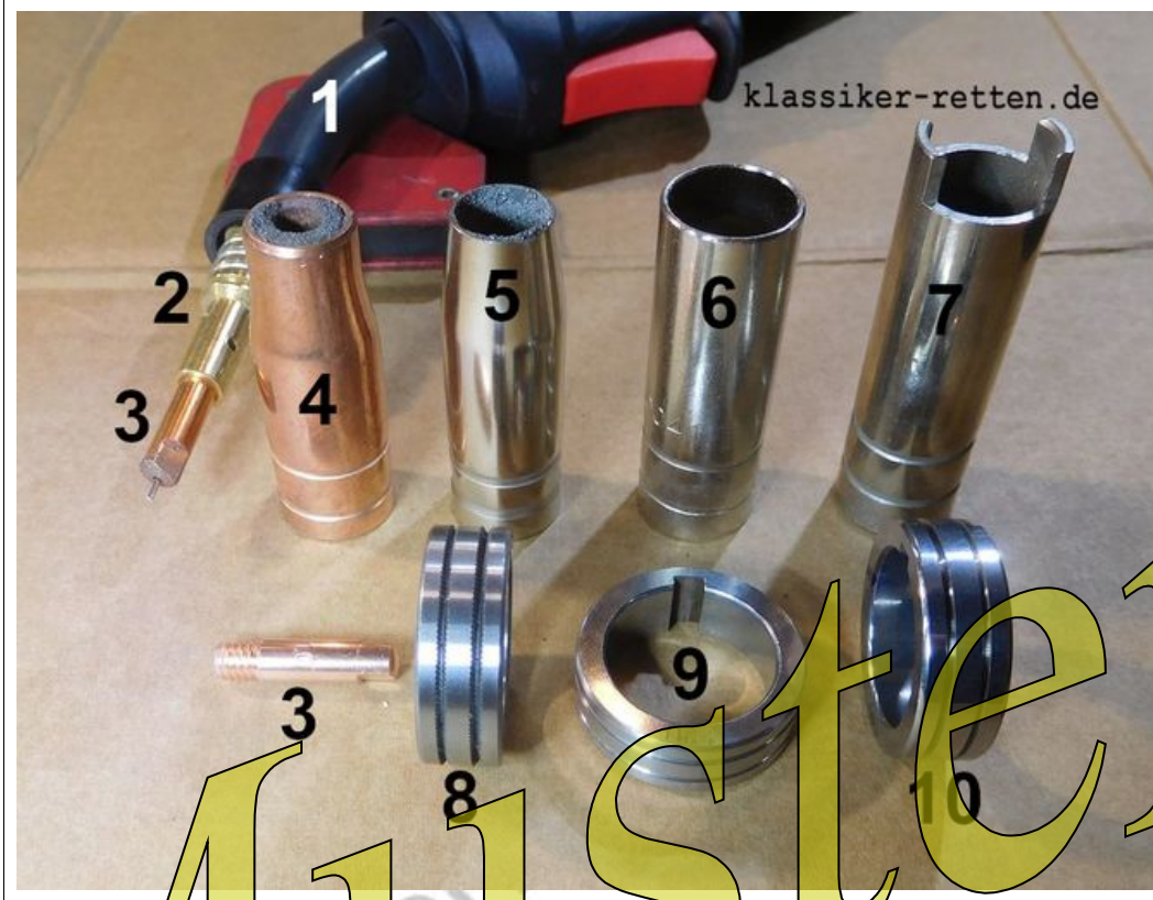
Abb.1-1: Vorschubrollen sowie Bau- und Verschleißteilübersicht MIG/MAG – Brenner Baugröße AK15.