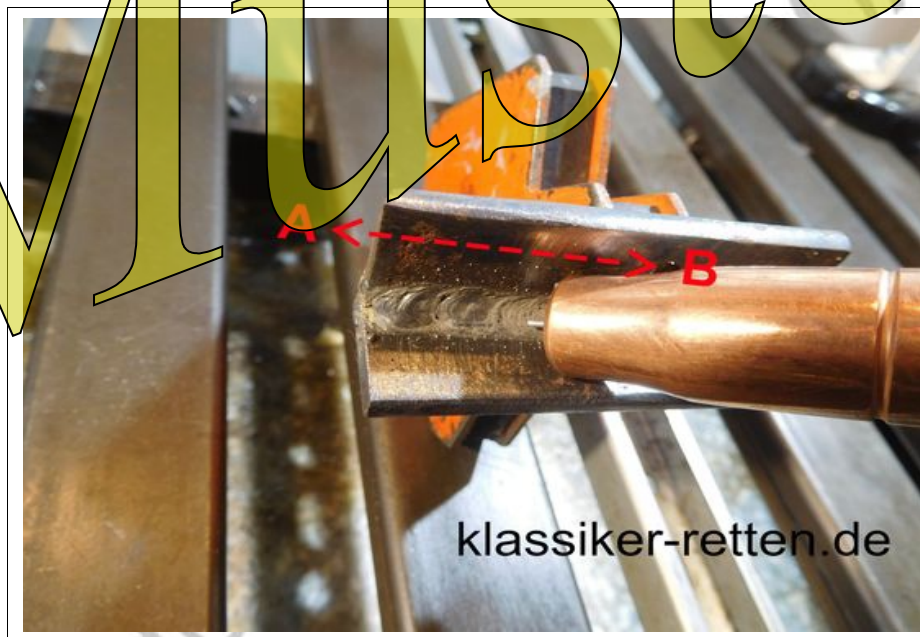
Abb. 1-5: Gute Sicht auf Drahtende und Naht bzw. Schmelzbad durch Neigung des Brenners

Ein erheblicher Vorteil des (leicht) stechenden Schweißens ist die mögliche Sicht auf das Drahtende und den Schweißbadbeginn und die dadurch mögliche Schweißbadkontrolle (Abb.1-5). Beim schleppendem Schweißen |