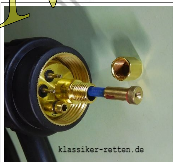
Abb. 1-3: {1-3} Euro-Zentralstecker des Schlauchpaketes. Zur Darstellung wurde die Überwurfmutter der Drahtseele entfernt und die Drahtseele (Federstahldraht mit blauer Kunststoffummantelung) etwas aus dem Schlauchpaket gezogen. Auch zu sehen: das Gasanschlussröhrchen (unten) sowie die beiden Stiftkontakte für den Stromkreis des Brenntasters.